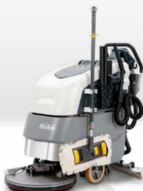
Scrubmaster B45 CLH