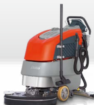
Scrubmaster B45 CL