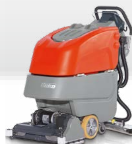
Scrubmaster B45 CL WB