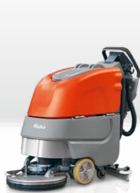
Scrubmaster B30 / CL